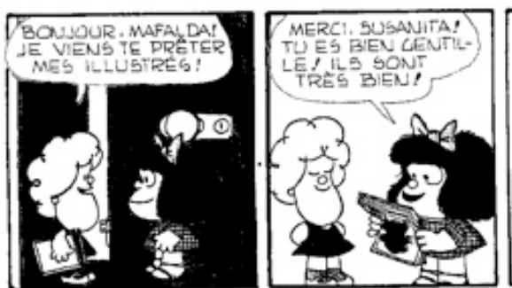
Quino, Encore Mafalda , © Glénat, 1980.